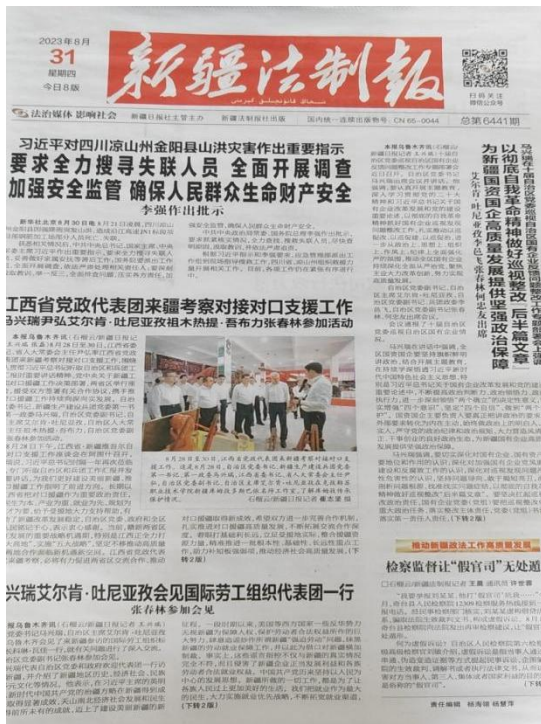
本项目第一次报纸公示截图