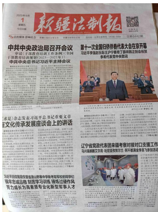
本项目第二次报纸公示截图