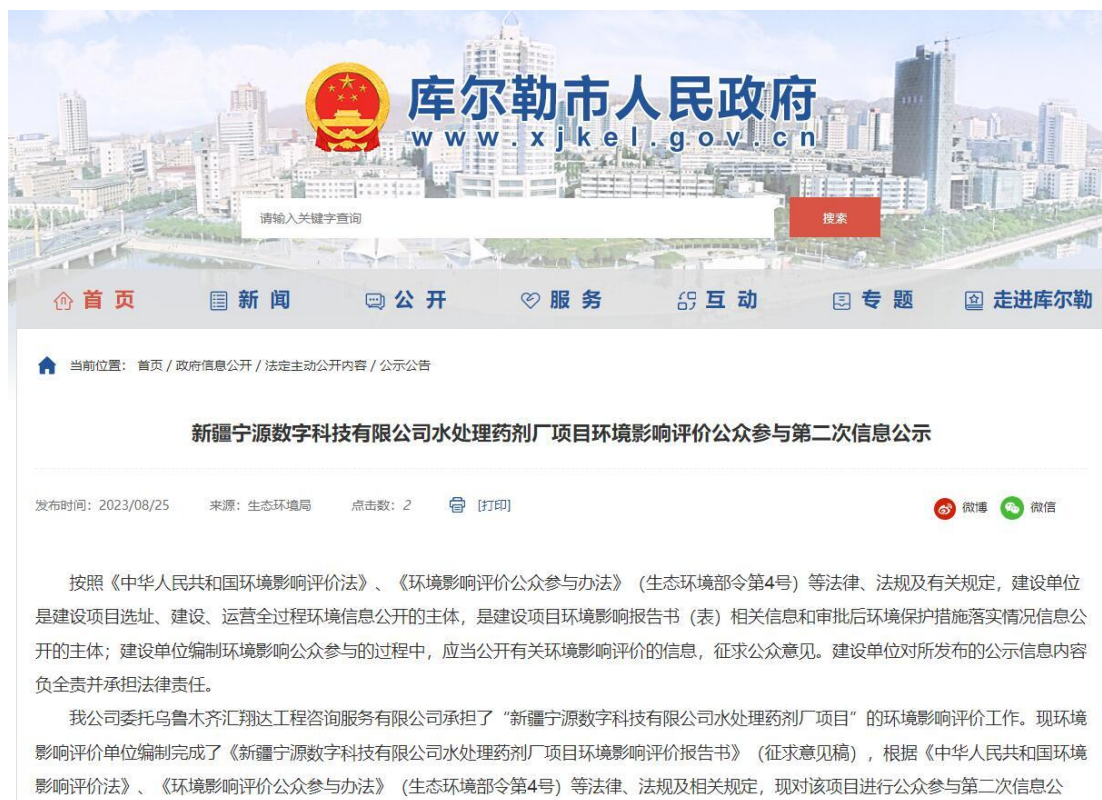
图 3-1 本项目征求意见稿网络公示截图

( http://www.xjkel.gov.cn/xjkrlls/c110138/202308/2f825e0f2eab4186bed5d24d64f74f0b.shtml ), 载体选择符合《环境影响评价公众参与办法》要求。公示截图请见图 3-1。